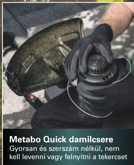
Metabo Quick damilcsere Gyorsan és szerszám nélkül, nem kell levenni vagy felnyitni a tekercset