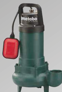
SP 24-46 SG