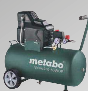
Basic 250-50 W OF