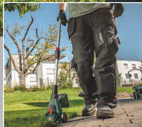
Kímélő munkavégzés Stabil teleszkópos rúd a fűszegély hátát kímélő, pontos vágásához