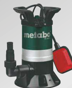
PS 7500 S