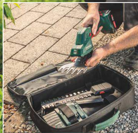
Metabo Quick rendszer Míndkét kés szerszám nélküli, gyors cseréje a rugalmas munkavégzéshez