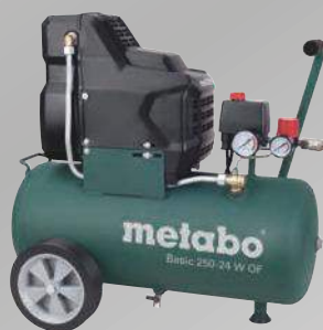
Basic 250-24 W OF