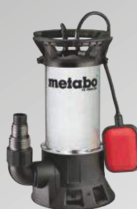
PS 1800 SN