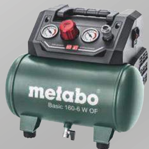
Basic 160-6 W OF