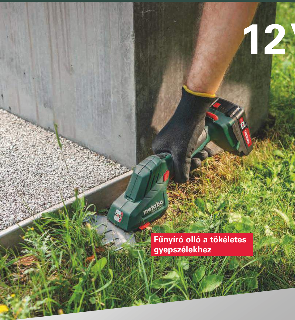
Fűnyíró olló a tökéletes gyepszélékhez